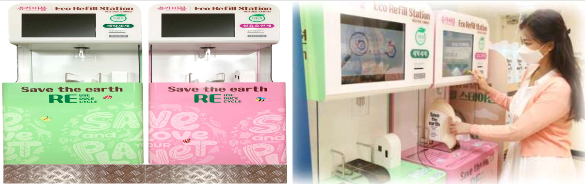
세탁세제 에코 리필 스테이션 사진 ※ 현재 일부 매장 운영중이며, 추후 확대 추진 예정