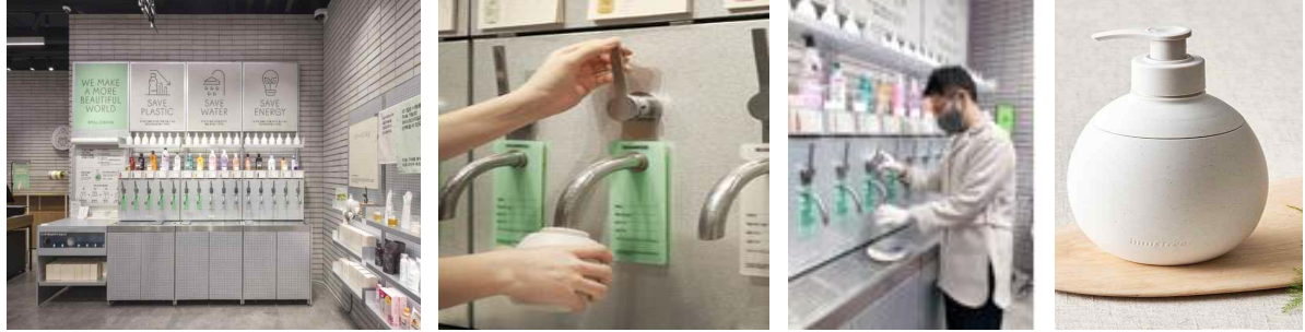
샴푸 및 바디워시 리필 스테이션 및 용기 사진 ※ 현재 일부 매장 운영중이며, 추후 확대 추진 예정