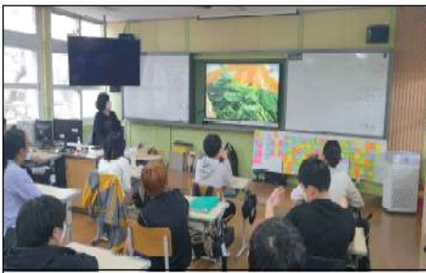
6학년 음식물쓰레기 줄이기 교육