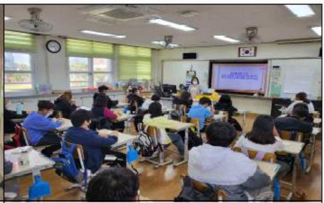
5학년 음식물쓰레기 줄이기 교육