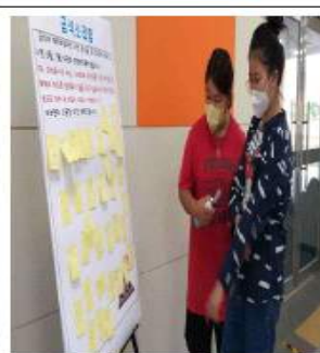
기호도 조사하는 모습