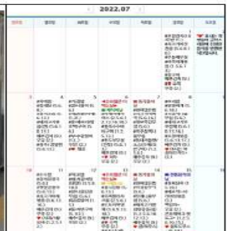
기호도 조사한 음식 식단에 반영