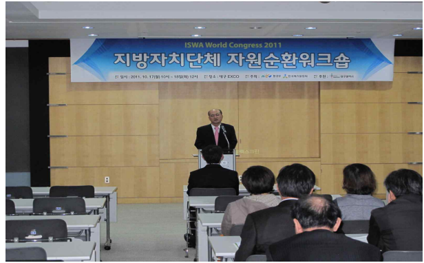
축사 - 환경부 자원순환국장 최흥진