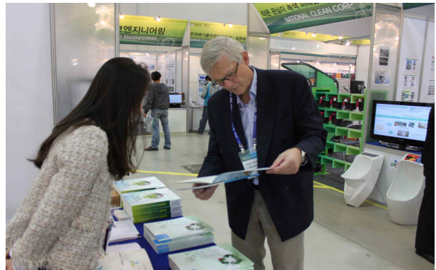
한국폐기물협회 - 전시부스