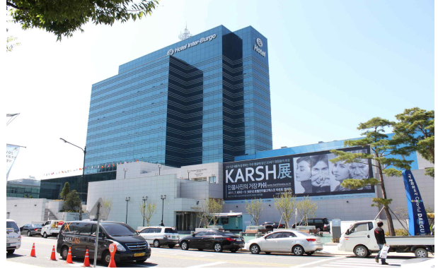
대구 인터블고 전경