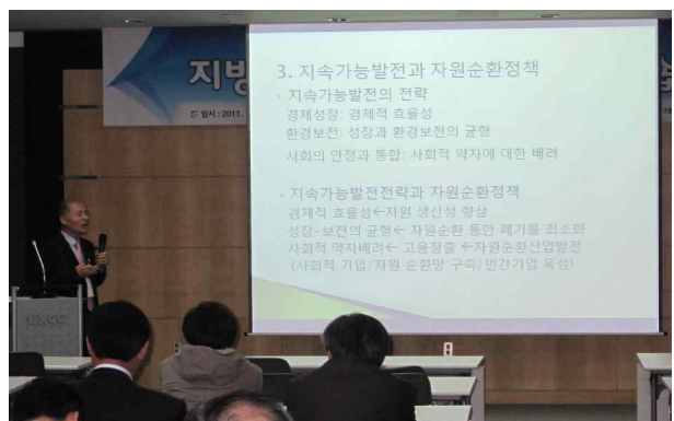
상명대학교 - 박준우 교수