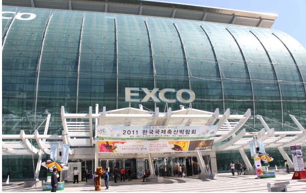
대구 EXCO 전경