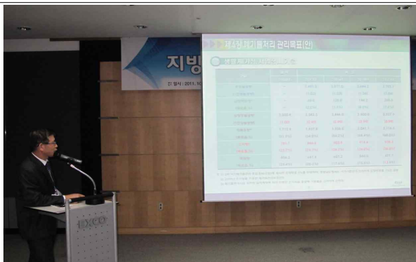
경상남도 - 박주일 팀장