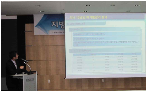
서울시정개발연구원 - 유기영 실장