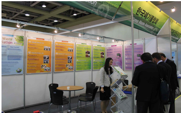
한국폐기물협회 - 전시부스