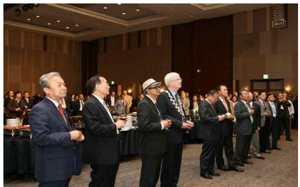
Welcome Reception 주요내빈